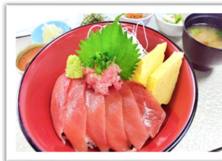
鮭漬け丼 1,870円 白米 または ・酢飯 お選びいただけます (昼食付 プラス440円)