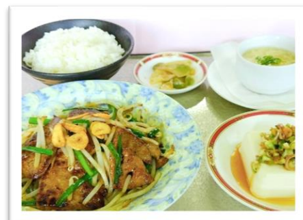
レバニラ炒め 1,650円 (昼食付 プラス220円)