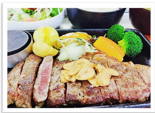
ステーキ膳 2,580円 (昼食付 プラス1,150円)