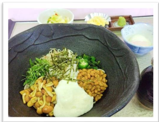
ねばトロ蕎麦 二八割 1,540円 (昼食付 プラス110円)