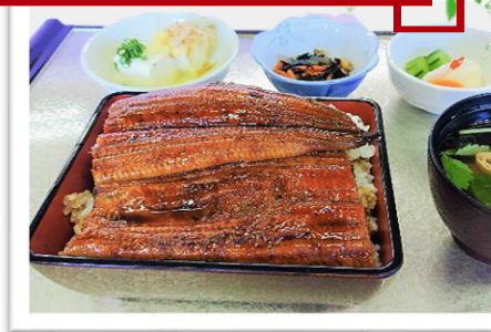
うな重 2,880円 (昼食付 プラス1,450円)