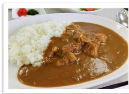
ビーフカレー 1,430円 税込み価格になっております