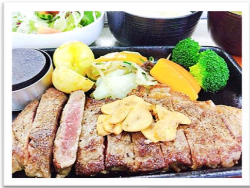
ステーキ膳 2,580円 (昼食付 プラス1,150円)