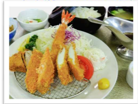
ミックスフライ 1,760円 豚ヒレ・イカ・サーモン・海老になります (昼食付 プラス330円)