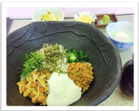
ねばトロ蕎麦 二八割 1,540円 (昼食付 プラス110円)