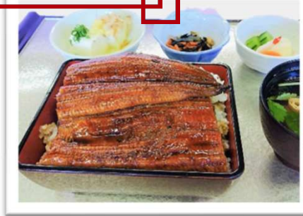
うな重 2,880円 (昼食付 プラス1,450円)