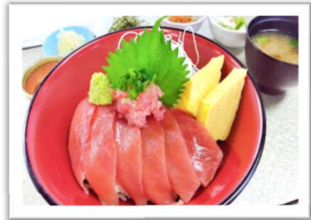
鮭漬け丼 1,720円 白米 または ・酢飯 お選びいただけます (昼食付 プラス290円)